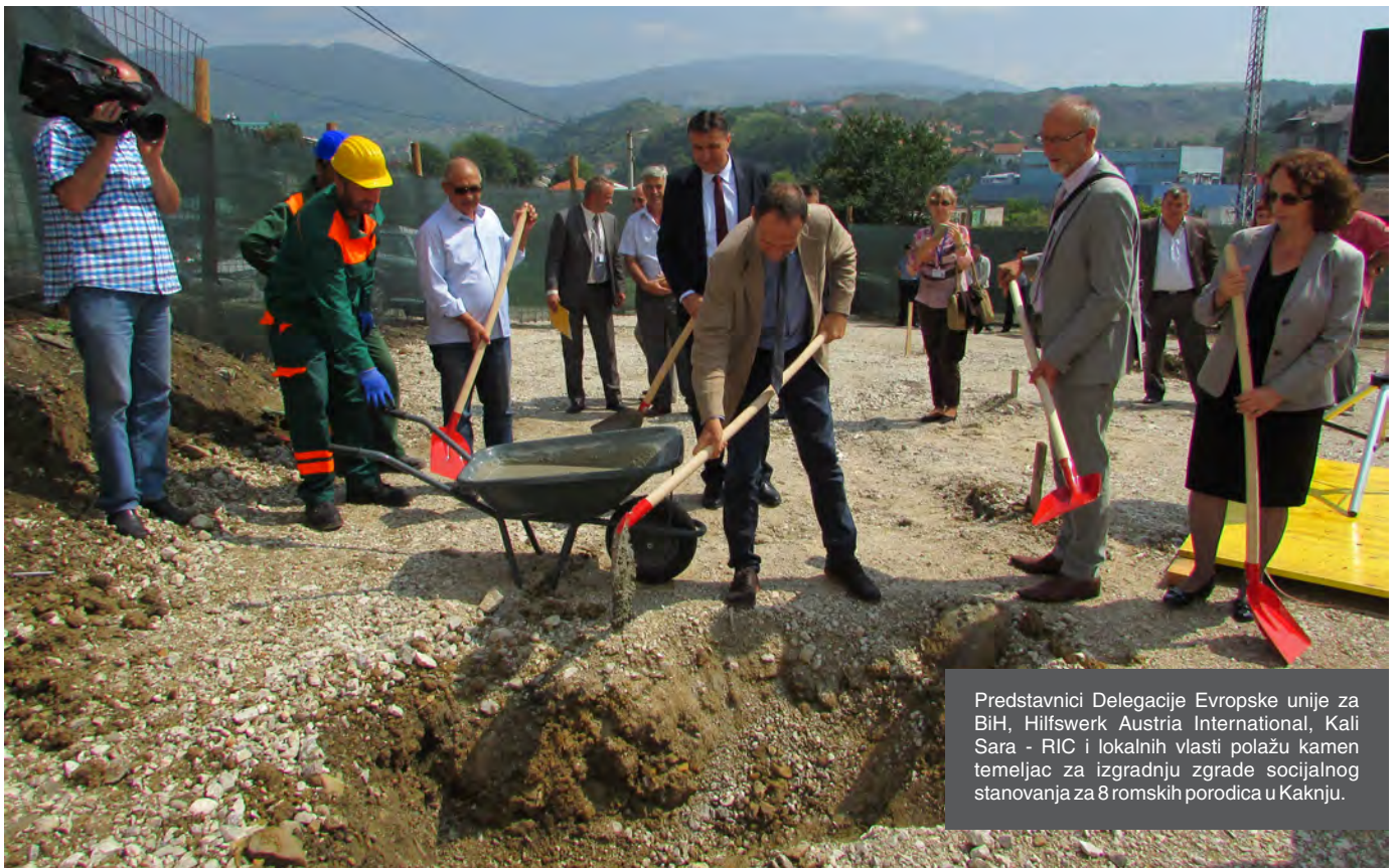
Predstavnici Delegacije Evropske unije za BiH, Hilfswerk Austria International, Kali Sara - RIC i lokalnih vlasti polažu kamen temeljac za izgradnju zgrade socijalnog stanovanja za 8 romskih porodica u Kakanju.