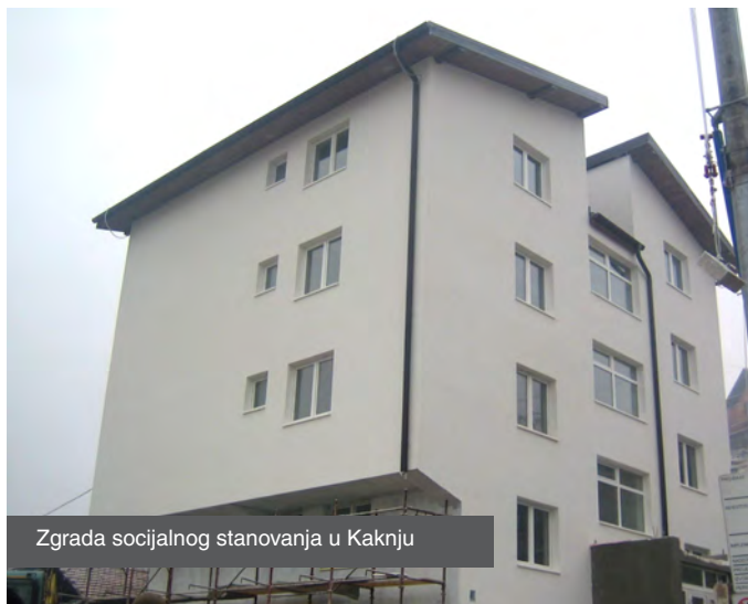
Zgrada socijalnog stanovanja u Kaknju