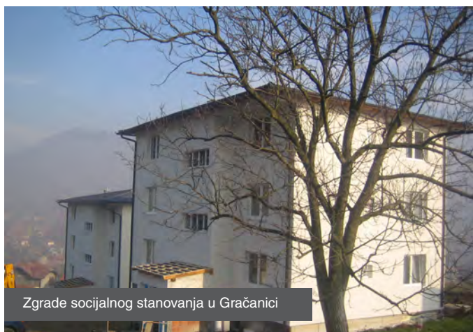
Zgrade socijalnog stanovanja u Gračanici

U toku je postupak odabira najpovoljnijeg ponuđača za izgradnju zgrade sa 18 stambenih jedinica socijalnog stanovanja u Brčko Distriktu BiH.