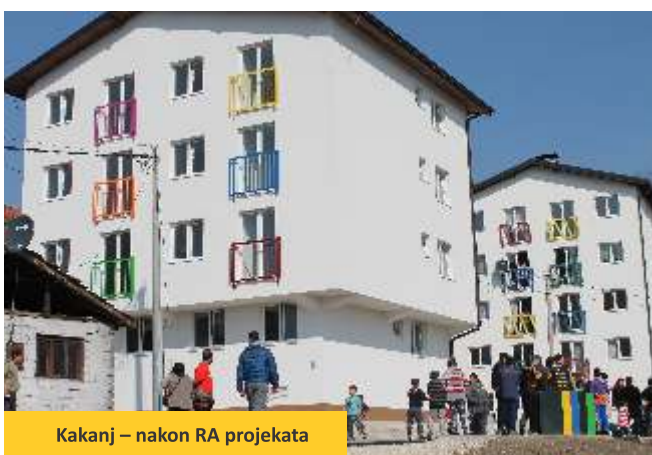
Kakanj – nakon RA projekata