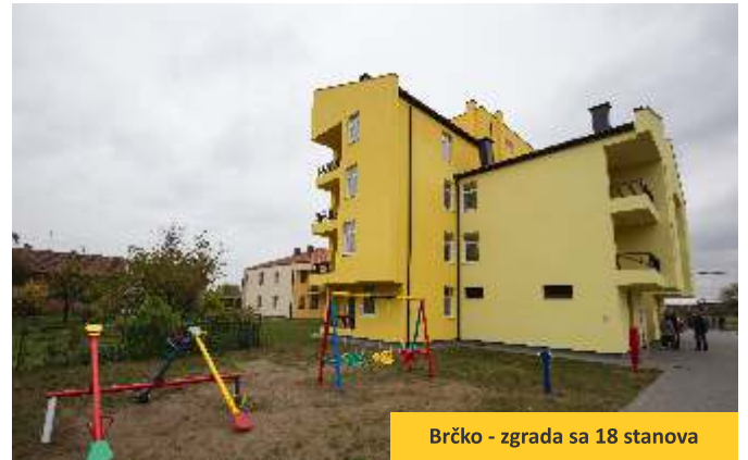
Brčko - zgrada sa 18 stanova