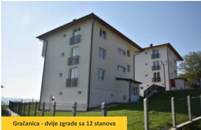
Gračanica - dvije zgrade sa 12 stanova

Lokalne administrativne uprave u svim ciljanim lokacijama su pored sufinansiranja aktivno učestvovalе u implementaciji projekta, i obezbijedile su zemljište za izgradnju, potrebne dozvole i priključke na infrastrukturu.