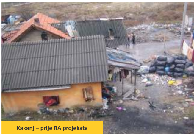
Kakanj – prije RA projekata

Zahvaljujući sredstvima EU i lokalnom sufinansiranju 140 romskih porodica u 9 zajednica u BiH znatno je poboljšalo svoje živote. Ključni koraci su napravljeni, od ranijeg beskućništva do sadašnjeg podstanarstva u moderanom stanu po sistemu socijalnog stanovanja, što je odlična polazna tačka za pristojno inkluzivno socijalno življenje.